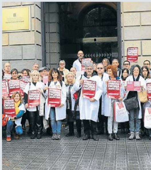
Metges davant la seu de l'ICS, a Barcelona, ahir durant la recollida de firmes.