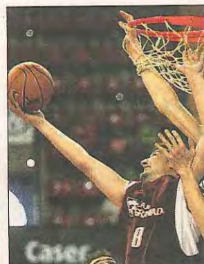
Los médicos del baloncesto tienen cita en San Sebastián.

ciación Española de Médicos del Baloncesto y los Servicios Médicos de San Sebastián Gipuzkoa Basket organizan sus XIX Jornadas hasta el sábado en el Palacio Miramar, en San