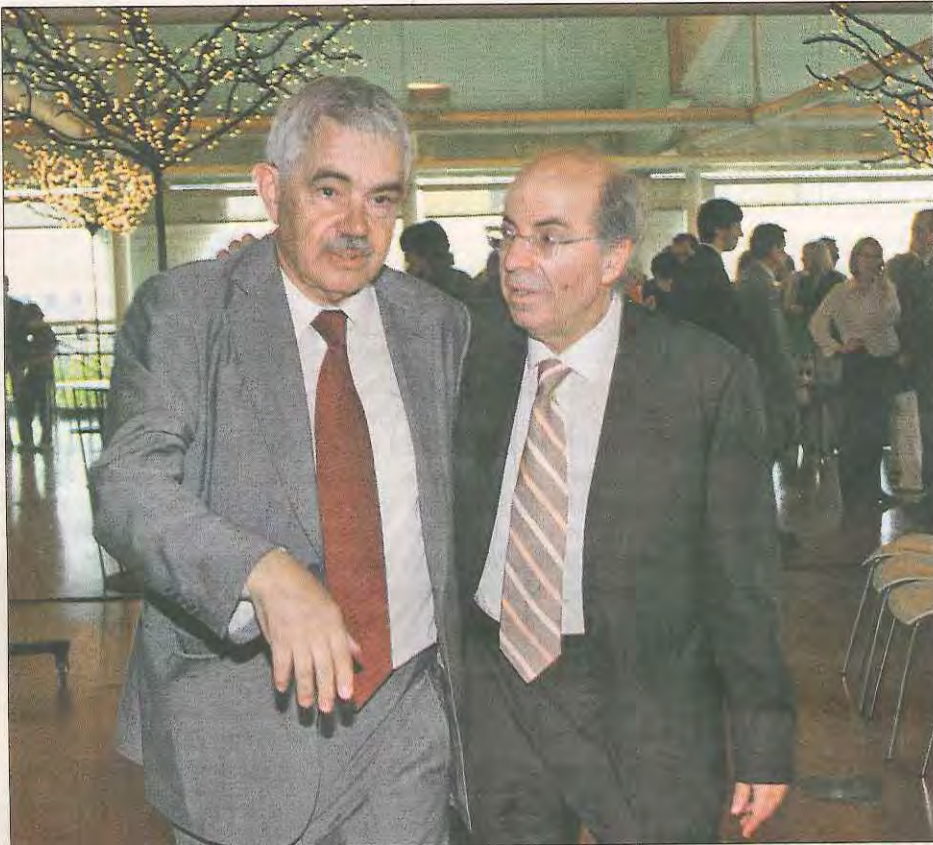
Jordi Camí camina abrazado a Pasqual Maragall en el acto de presentación de su fundación.

-Nos proponemos acudir a todas aquellas personas y empresas con grandes recursos, tanto de España como de fuera, por poco que podamos. Tenemos que convencernos de que es hora de romper con la mala fama que tiene nuestro país en materia de altruismo, pero también ofreceremos oportunidades de inversión (de riesgo) en investigación y